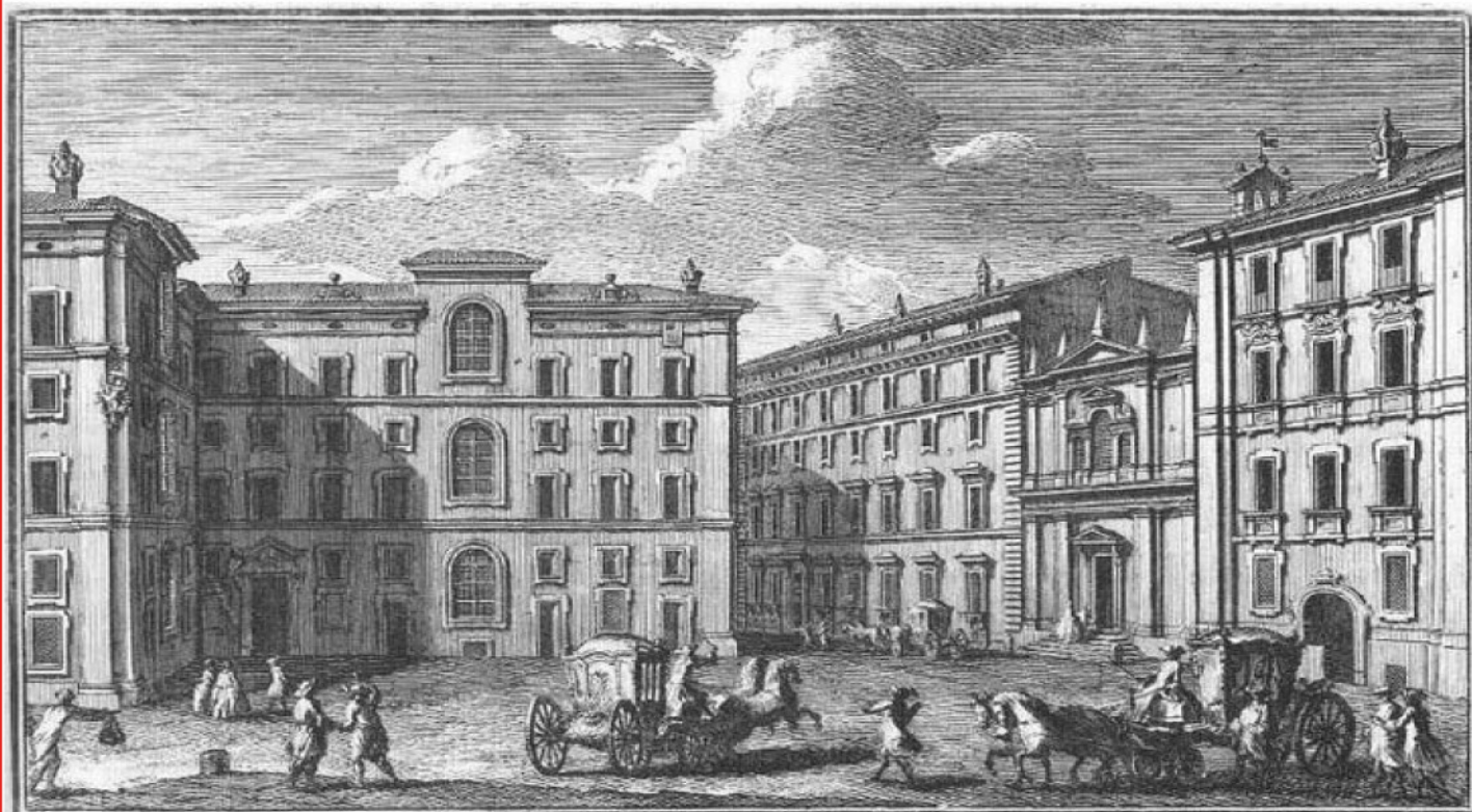
Seminario Romano 1. Caricamento, che corrisponde sulla piazza di S. Ignazio, a Chiesa di S. Marco 2. Prospetto del Seminario Romano, a Parte del Convento dei PP. Domenicani