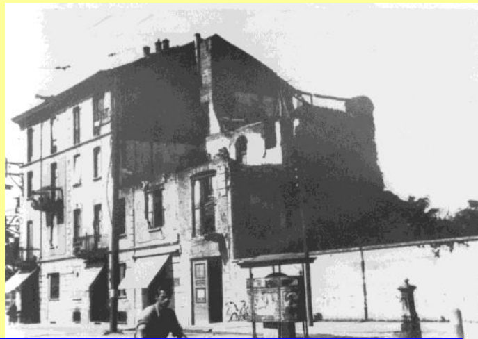
Trattoria San Michele dopo il bombardamento e una casa bombardata in viale Monza