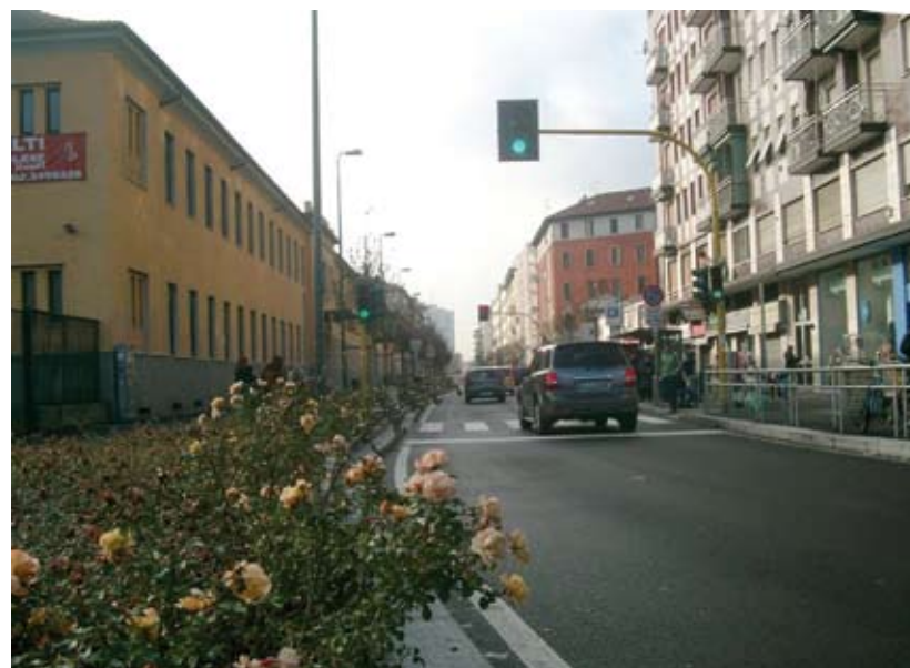
Via Polesine dimezzata ma con le rose